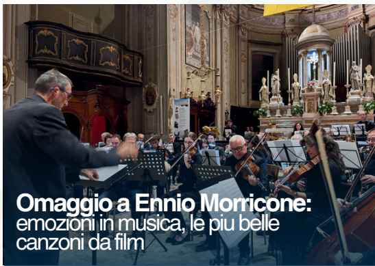
Omaggio a Ennio Morricone: emozioni in musica, le più belle canzoni da film

Sport e cultura continuano a rappresentare due pilastri fondamentali della vita della nostra comunità. Per questo l'Amministrazione Comunale prosegue il proprio impegno nel sostenere le associazioni, valorizzare le iniziative del territorio e creare occasioni di incontro e di progettualità congiunte. Lo sport si conferma un motore importante della vita gaggianese, con circa 500 minori iscritti alle attività delle associazioni. Rete diversificata e in crescita, composta da ASD Basket Gaggiano, ASD Freccia Azzurra, ASD Mizu Tamashii Dojo, ASD Twirling Gaggiano, ASD Taekwondo Gaggiano, ASD Golf San Vito, WCS Milano, ASD Mantovani Ciclismo, ASD G-In Move, Gaggiano Padel, ASD Sport Academy e molti professionisti. Prosegue il coordinamento degli impianti comunali e a breve prenderanno il via i lavori di riqualificazione del Palazzetto dello Sport di via Gramsci.