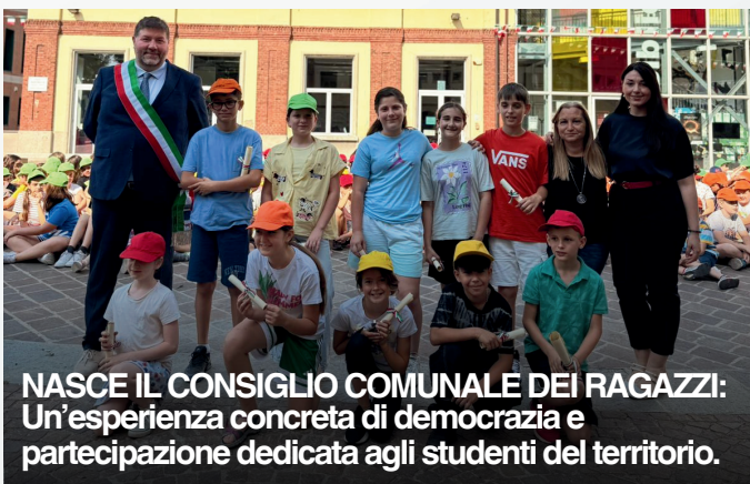
NASCE IL CONSIGLIO COMUNALE DEI RAGAZZI: Un'esperienza concreta di democrazia e partecipazione dedicata agli studenti del territorio.

L'Amministrazione ha inoltre approvato il regolamento per le borse di studio destinate agli studenti della scuola secondaria e confermato i Premi "Aldo e Cele Daccò", assegnati ogni anno per valorizzare merito, impegno e risultati scolastici. Prosegue infine l'impegno sul fronte della legalità con la partecipazione alla Primavera della Legalità 2026, che ha coinvolto scuole e cittadinanza attraverso laboratori, incontri istituzionali, iniziative educative e momenti di riflessione dedicati alla memoria delle vittime delle mafie.