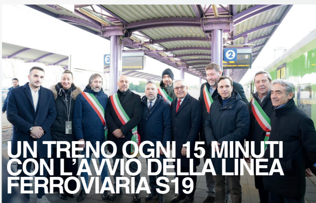
UN TRENO OGNI 15 MINUTI CON L'AVVIO DELLA LINEA FERROVIARIA S19

Nell'ultimo periodo sono stati effettuati 123 controlli ambientali, supportati dall'utilizzo di fototrappole e dall'installazione di nuove telecamere nelle aree più critiche del territorio. L'impegno per la sicurezza si estende anche ai luoghi più sensibili della comunità. Presso il cimitero di San Vito sono state infatti installate nuove telecamere di videosorveglianza, con l'obiettivo di garantire maggiore tutela e protezione di uno spazio particolarmente significativo per i cittadini.