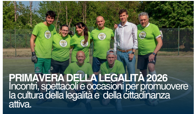
PRIMAVERA DELLA LEGALITÀ 2026 Incontri, spettacoli e occasioni per promuovere la cultura della legalità e della cittadinanza attiva.

Per il 2026 è confermato il Fattore Famiglia, con riduzioni del 20% per il secondo figlio e del 40% dal terzo in poi sui principali servizi scolastici: refezione, pre e post scuola e nuovo Campus Comunale. Per la fascia 0-6 anni è proseguita la collaborazione tra il nido comunale Angelo Malabarba, le scuole dell'infanzia e le realtà educative convenzionate, che hanno promosso iniziative condivise come la decorazione dell'albero di Natale in Piazza Ferraroni e il progetto "La Pace in Arte". Sono inoltre in fase di conclusione i lavori del nuovo Polo 0-6, mentre il Comune ha partecipato a un bando da 168 mila euro per l'acquisto di nuovi arredi e strumenti didattici. Tra le novità più significative figura la nascita del Consiglio Comunale dei Ragazzi e delle Ragazze, che inizierà la propria attività dall'autunno offrendo agli studenti un'esperienza concreta di partecipazione democratica e cittadinanza attiva.