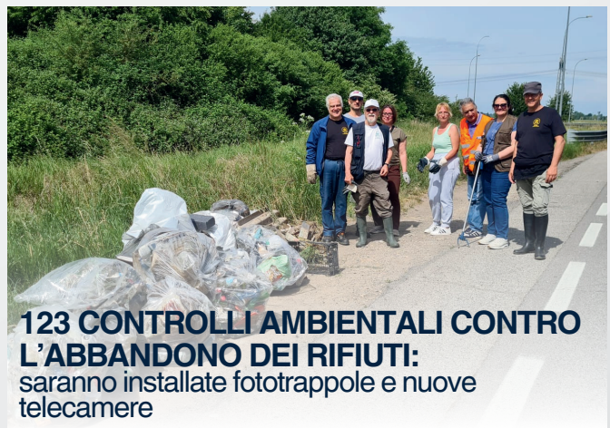
123 CONTROLLI AMBIENTALI CONTRO L'ABBANDONO DEI RIFIUTI: saranno installate fototrappole e nuove telecamere