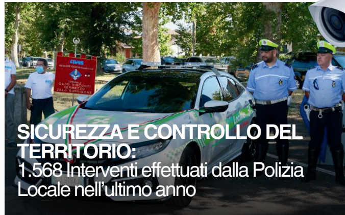
SICUREZZA E CONTROLLO DEL TERRITORIO: 1.568 Interventi effettuati dalla Polizia Locale nell'ultimo anno

Particolare attenzione è stata dedicata anche al contrasto dell'abbandono dei rifiuti, fenomeno che incide sul decoro urbano e sulla qualità dell'ambiente.